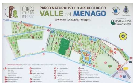
Parco valle del Menago a Bovolone,