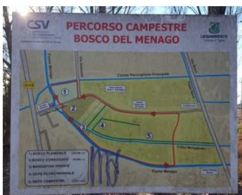
Bosco del Menago a Bovolino,

Il Menago in questi anni è stato valorizzato con la realizzazione 4 parchi: