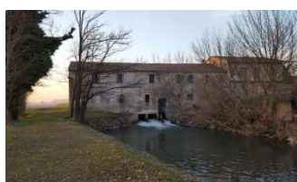
Mulino di Asparetto,