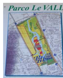
Parco Vallette a Cerea,