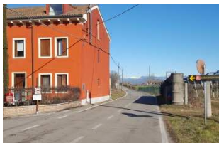
Mulino Rosso a Bovolino,

Con la collaborazione del Consorzio di Bonifica Veronese, del Comune di Bovolone e di tutti i Comuni del Menago