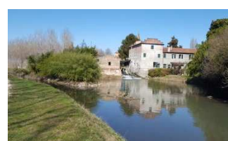
Mulino di San Zeno di Cerea

Il Menago in questi anni è stato valorizzato con la realizzazione 4 parchi: