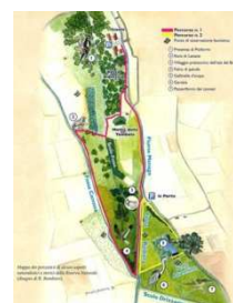
Parco Brusà a Cerea

I Comuni ove transita il Menago desiderano riqualificare gli argini del Fiume realizzando una ciclopista che colleghi la ciclopista delle Risorgive alla futura ciclopista sulla ex ferrovia Ostiglia Treviso, consentendo di sviluppare numerosi percorsi al contorno. I Comuni di Buttapietra, San Giovanni Lupatoto, Oppeano, Isola della Scala, Cerea e Casaleone con Capofila Bovolone hanno affidato uno studio tecnico ed economico per approfondire la fattibilità della ciclovie del Menago.