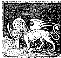
REGIONE DEL VENETO