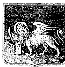
REGIONE DEL VENETO